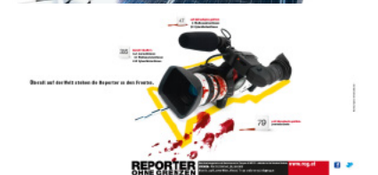
REPORTER OHNE GRENZEN Kampagne