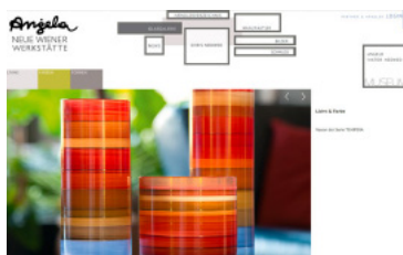
ANGELA-NEUE WIENER WERKSTÄTTE