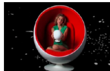
SAINT PRIVAT Musikvideo https://www.youtube.com/watch?v=a0BWueTuXp0