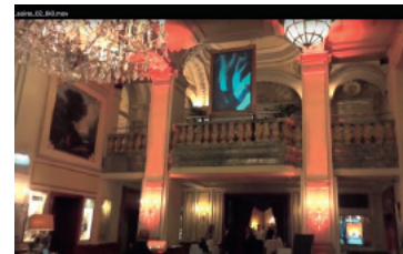
HOTEL IMPERIAL Installation https://www.youtube.com/watch?t=2&v=oA4kF-kUR4Z0