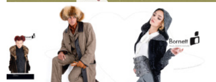
WSA Katalog, Eventdesign, Billboards Abu Dhabi