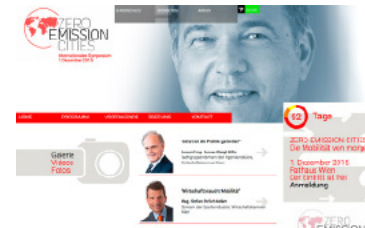
ZERO EMISSION CITIES WKW, Industrie