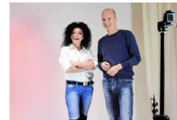
Das Auftritts-, Medien- und Motivationstraining speziell für Frauen

Es gibt sehr viele kompetente und qualifizierte Frauen, es sind jedoch in der Regel Männer, die in Podiumsdiskussionen, im TV oder als Redner bei Veranstaltungen den Ton angeben. Frauen melden sich seltener zu Wort und sind selbstkritischer.