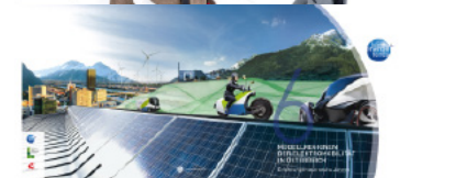
KLIMA- UND ENERGIEFONDS 6 Jahre Energie Modellregionen