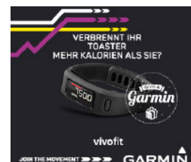
GARMIN Banner Kampagne Facebook Gewinnspiel (Kooperation Moonshiner)