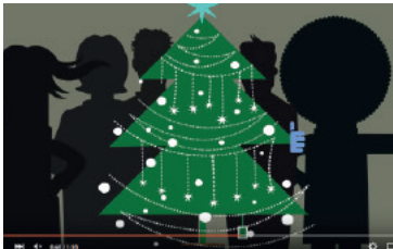
GMI Christmas Greetings Animation https://www.youtube.com/watch?v=uo1sqzpw_bA

Unser Video-Department hat reichlich Erfahrungen mit Video-Installationen und Projektionen bei Events, Großveranstaltungen und Kunstinterventionen.