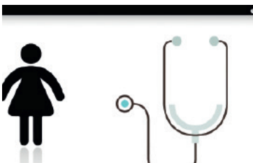
FHCH0L Konferenz- und Webvideo https://www.youtube.com/watch?v=SSnzyhVIZ3I