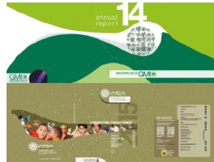
GMI/Gregor Mendel Institute Jahresbericht